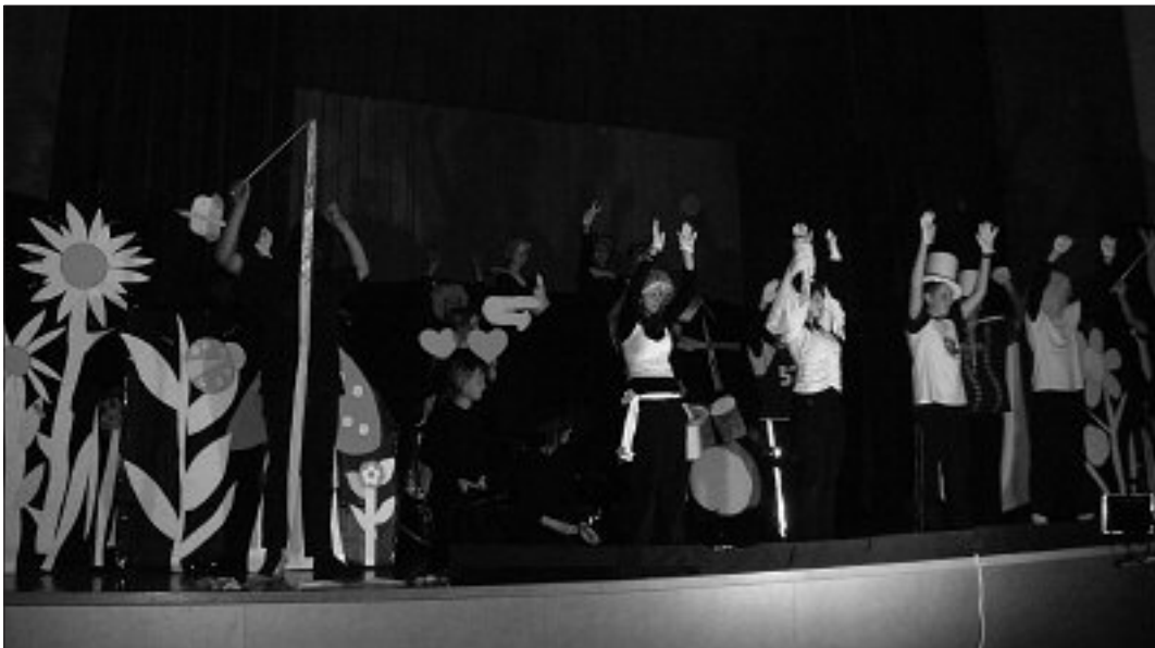
Schwarzlicht-Theaterstück über Shakespeares „Sommernachtstraum“, aufgeführt durch die 3c der VS Eferding Nord.

Aus den Siegern des Aufsatzwettbewerbes wurde ein Aufsatz gelost, der im Rahmen der Eröffnung am 2. Juni vorgetragen wurde. Der Verfasser durfte dann das Band bei der Eröffnung mit durchschneiden.