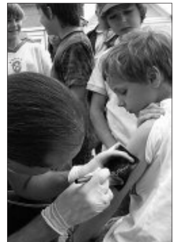
Die Mutigen ließen sich „tätowieren“.