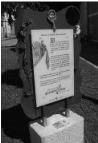
Eine der G'schichtnweg-Stationen.