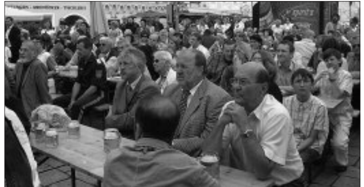
Zahlreiche Prominenz unter dem erschienenen Publikum am Eferdinger Stadtplatz.

Abend die Lesung „Die Nibelungen“ von Michael Köhlmeier im Stadtsaal Eferding. Die Zuhörer waren begeistert und so wird dieser ereignisreiche Tag bei vielen in schöner Erinnerung bleiben.