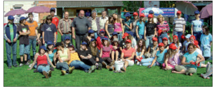
Viele fleißige Hände halfen mit, die städtischen Bachufer vom Müll zu befreien.

lern und ihren Lehrerinnen. Unserer aller Umwelt – zuliebe!