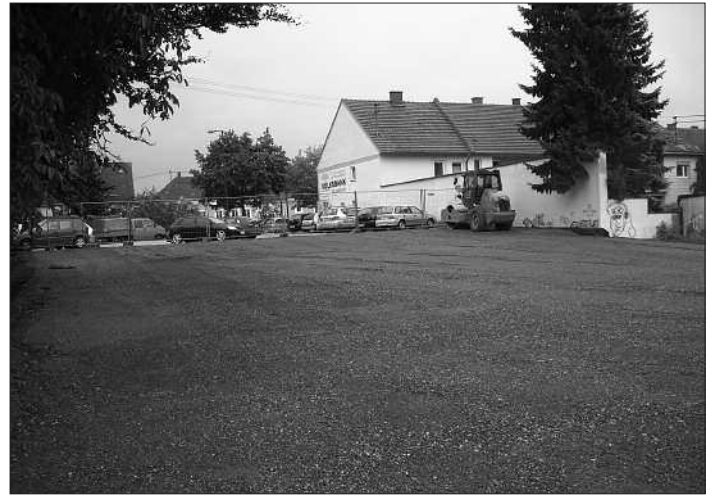
Die Erweiterung Parkplatz Oberer Graben.