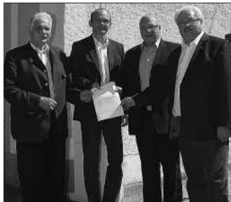
Die vier Bürgermeister des Zukunftsraumes Eferding nach der Unterzeichnung des Kindergarten-Kaufvertrages.

In der ersten Augustwoche 2011 unterschrieben die vier Bürgermeister aus Fraham, Hinzenbach, Puppung und Eferding den Vertrag zum Kauf des Kindergartens der Karmeliter am Schiferplatz. Erstmals in der Geschichte dieser vier Gemeinden, wurde zu gleichen Teilen gemeinsam ein Gebäude angekauft, um die Kinderbetreuung in diesem Kindergarten, der 1864 von der Kongregation der Marienschwestern von Karmel gegründet wurde, auch weiterhin für die vier Gemeinden zu sichern. Der Kindergarten wird im Herbst unter der Betreuung der Caritas mit vier Regelgruppen, einer Einzelintegrationsgruppe und einer alterserweiterten Gruppe fortgesetzt. Insgesamt werden in diesem traditionellen Kindergarten 130 Kinder in 6 Gruppen untergebracht. Mit dem Angebot im Städtischen Kindergarten, wo 107 Kinder betreut werden, stehen in