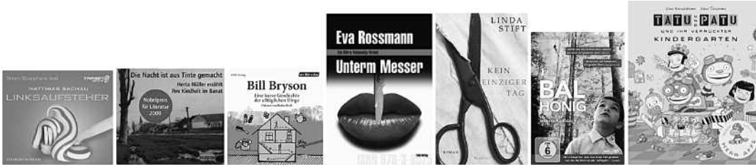
Einige der Bücher aus dem aktuellen Angebot der Stadtbücherei Eferding.