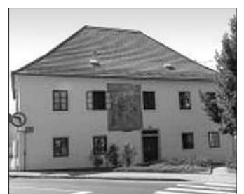
Das neue Verbändehaus am Josef-Mitter-Platz 2.

30 – Regionalentwicklungsverband. Das Service wird zu den gewohnten Bürozeiten angeboten!