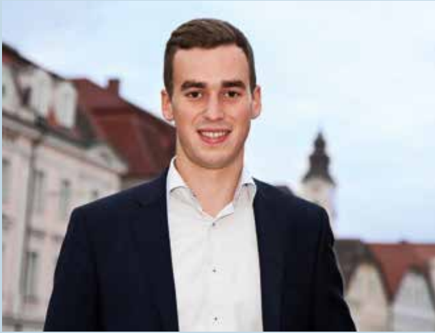
Bürgermeister Severin Mair