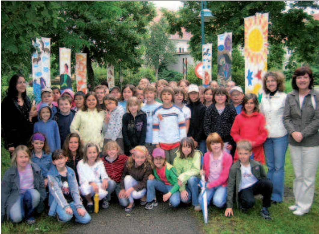
Die 4a und 4b der VS Nord fertigten mit ihren Werklehrerinnen bunte Fahnen für den Eferdinger G'schichtnweg.