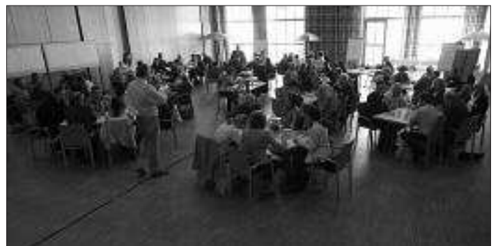
Teilnehmer der Regef-Nachfolgekonferenz im Schauburgsaal Hartkirchen.

Eferding setzt mit derartigen Veranstaltungen Impulse zur Aktivierung der Menschen, denn die Umsetzung der regionalen Entwicklungsziele braucht eine intensive BürgerInnenbeteiligung. „Der REGEF hat sich zum Ziel gesetzt, die Menschen zu befähigen, ihre Zukunft selbst in die Hand zu nehmen und die erforderlichen Rahmenbedingungen zu schaffen“,