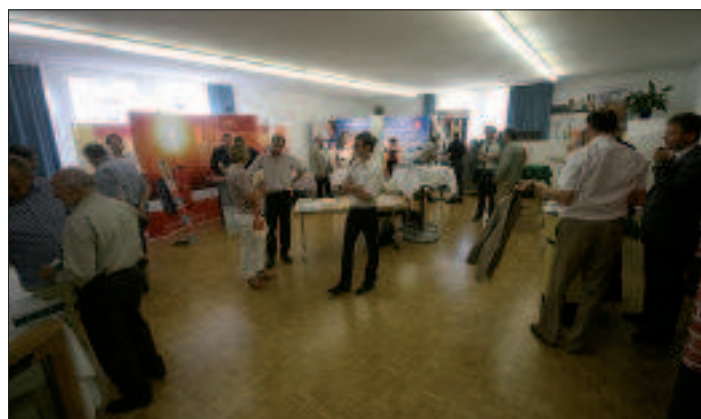
Die Mini-Energiespar-Messe im Stadtsaal Eferding bot umfassende Informationsmöglichkeiten rund um das Thema „Erneuerbare Energie“.

Der Energie-Info-Tag war mit der Präsentation des Energieentwicklungsplanes nicht nur Abschluss eines mehr als zwei Jahre dauernden Entwicklungsprozesses sondern viel mehr der Startschuss und der erste Schritt auf dem Weg des Raumes Eferding zur Energie-Muster-Region.