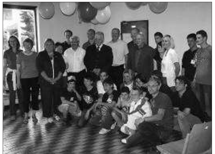
Die Bürgermeister und Gemeindevorstände der Gemeinden des Zukunftsraumes, die Betreuer und die Jugendlichen freuen sich über ihre schönen neuen Räumlichkeiten.

Wir bitten um Bekanntgabe unter der Tel.-Nr. 0 72 72 / 55 55 - 121.