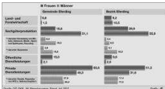
Wirtschaftsstruktur – Anteil der unselbständig Beschäftigten in Eferding.

30,6 Prozent der Einwohner/-innen der vier Gemeinden arbeiten vor Ort. Das ist ein deutlich höherer Anteil als im Durchschnitt der zwölf Gemeinden des gesamten Bezirks (17,6 Prozent). Insgesamt haben 42,4 Prozent der in der Gemeinde Eferding (und den Nachbargemeinden) wohnhaften Arbeitnehmer/-innen ihren Arbeitsplatz im Bezirk. Der Anteil der