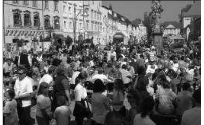
Rekordbesuch beim Sternmarsch und beim Maibaumfest am Eferdinger Stadtplatz.

Weinverkostung mit Jause in die Raiffeisenbank Eferding geladen und die Alkovener machten eine LILLO-Fahrt nach Prambachkirchen in das Radio-Museum. Allen Spendern der tollen Preise sei hier noch einmal ein herzliches Dankeschön gesagt!